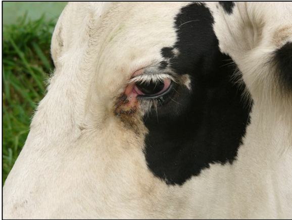
Rötung der Lidbindehäute und Tränenfluss