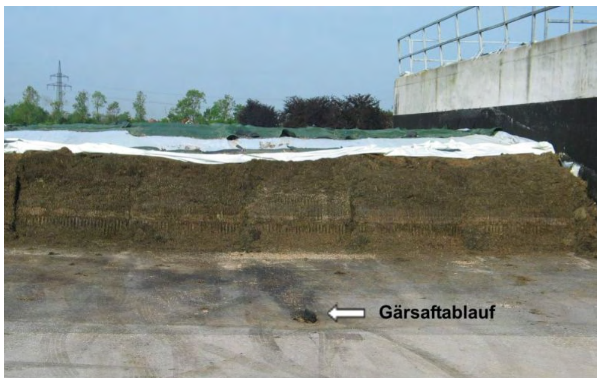
Abb. 4: Grassilage im Anschnitt mit Gärsaftablauf

Bei größeren Siloanlagen ist die Entwässerung in Teilflächen zu prüfen, um nicht verunreinigtes von verunreinigtem Niederschlagswasser zu trennen.