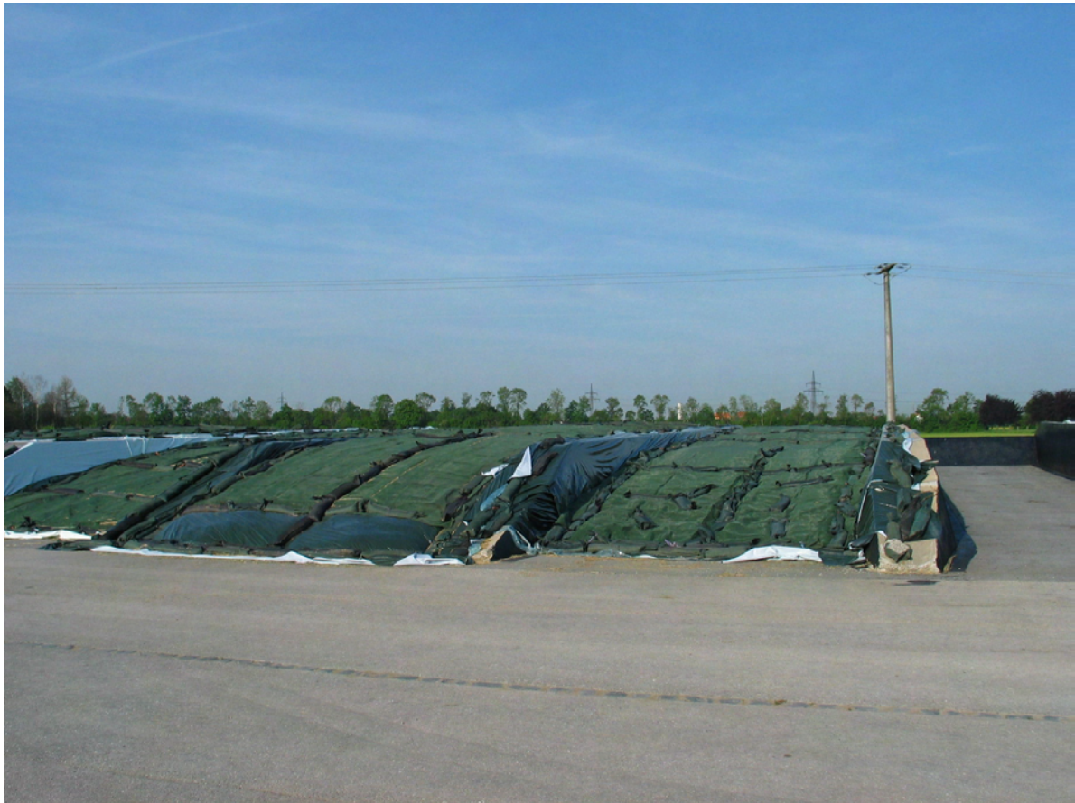
Abb. 3: Fahrsiloplanlage mit vollständiger Abdeckung

Die Anlage des Silos und das Silomanagement sind die entscheidenden Ansatzpunkte, den Anfall gering zu halten.