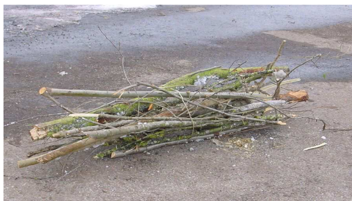
Zum Bündeln von holzigen Gartenabfällen dürfen keine Kunststoffstricke verwendet werden. Am besten eignet sich ausreichend starker Bindfaden.

Die Bereitstellung darf frühestens einen Tag vor der Abholung erfolgen.